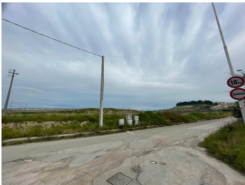
Figura 3 Avvio della Via Anfiteatro, sullo sfondo “il bosco” del Castello

Concorso di progettazione a procedura aperta in due gradi in modalità informatica “PARCO DELL’ANFITEATRO E DELLE FORNACI” CIG: 9640682E73 - CUP: I22B23000000006 Ente Committente e Appaltatore: Comune di Canosa di Puglia Piazza Martiri del XXIII Maggio n.15, CAP 76012 Provincia: BT