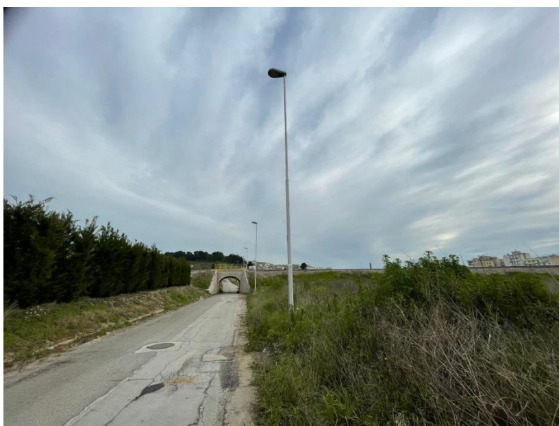
Figura 4 Via Anfiteatro prima dell’attraversamento della ferrovia