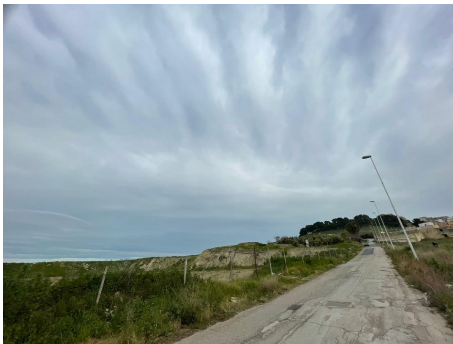
Figura 1 Via Anfiteatro, percorso verso il Castello Santi Quaranta Martiri, sulla sinistra l’area di sedime dell’Anfiteatro Romano