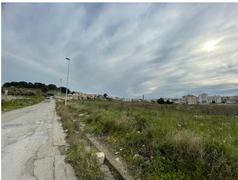
Figura 5 Via Anfiteatro dopo l’attraversamento ferroviario, si scorgono sulla destra le tre fornaci

Concorso di progettazione a procedura aperta in due gradi in modalità informatica “PARCO DELL’ANFITEATRO E DELLE FORNACI” CIG: 9640682E73 - CUP: I22B23000000006 Ente Committente e Appaltatore: Comune di Canosa di Puglia Piazza Martiri del XXIII Maggio n.15, CAP 76012 Provincia: BT