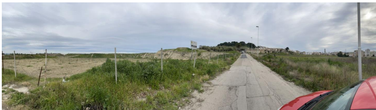
Figura 7 Area oggetto di intervento progettuale: sulla destra si scorgono le tre fornaci

Concorso di progettazione a procedura aperta in due gradi in modalità informatica “PARCO DELL’ANFITEATRO E DELLE FORNACI” CIG: 9640682E73 - CUP: I22B23000000006 Ente Committente e Appaltatore: Comune di Canosa di Puglia Piazza Martiri del XXIII Maggio n.15, CAP 76012 Provincia: BT