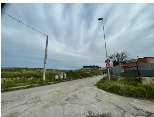
Figura 2 Innesco della Via Anfiteatro sulla Strada Provinciale San Paolo