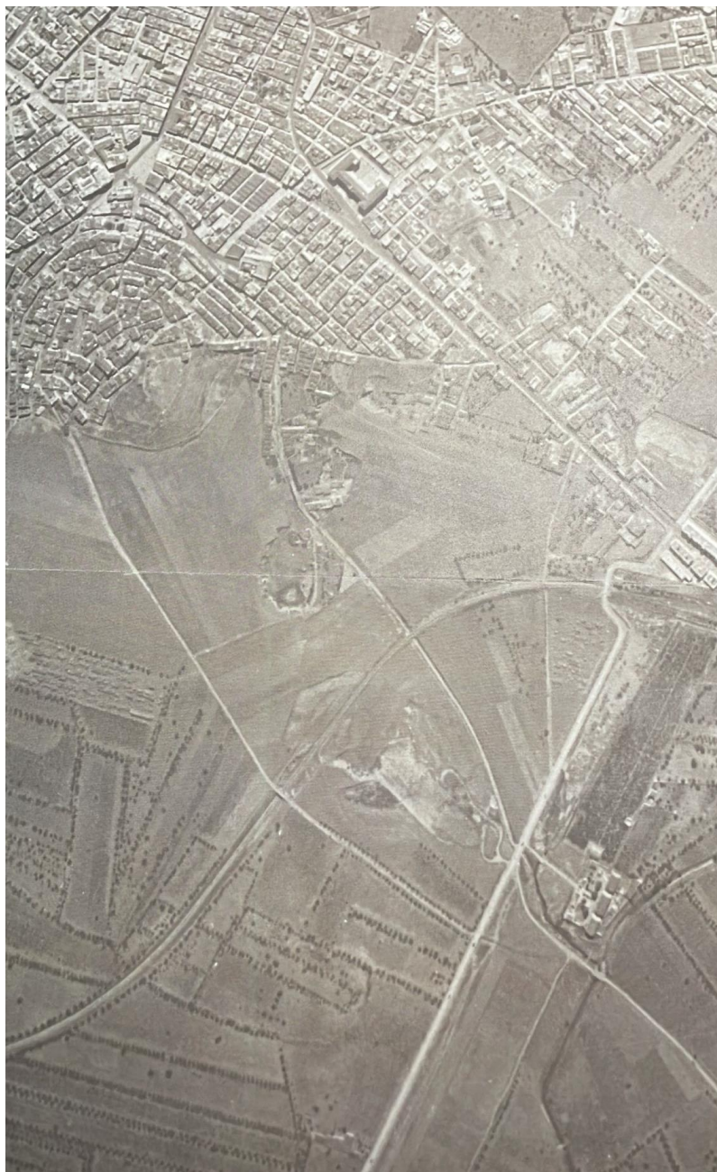
Figura 1 Ortofoto dell'area di intervento del 1954

Foto aerea Foto aerea dell'area oggetto di intervento